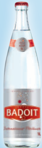
BADOIT ROUGE (50cl, 1l - VC)