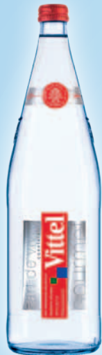
VITTEL (25cl, 50cl, 1l - VC)