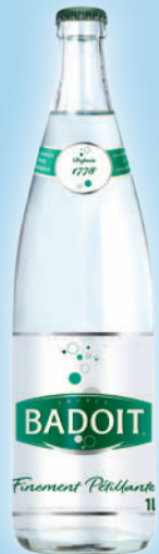
BADOIT VERTE (25cl, 50cl, 1l - VC)