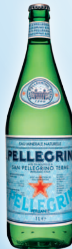
SAN PELLEGRINO (25cl, 50cl, 1l - VC)