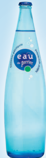
EAU DE PERRIER (50cl, 1l - VC)