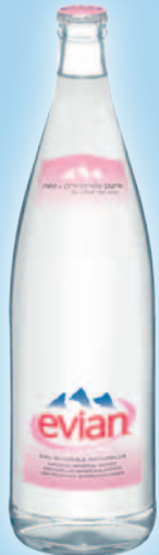
EVIAN (25cl, 50cl, 1l - VC)